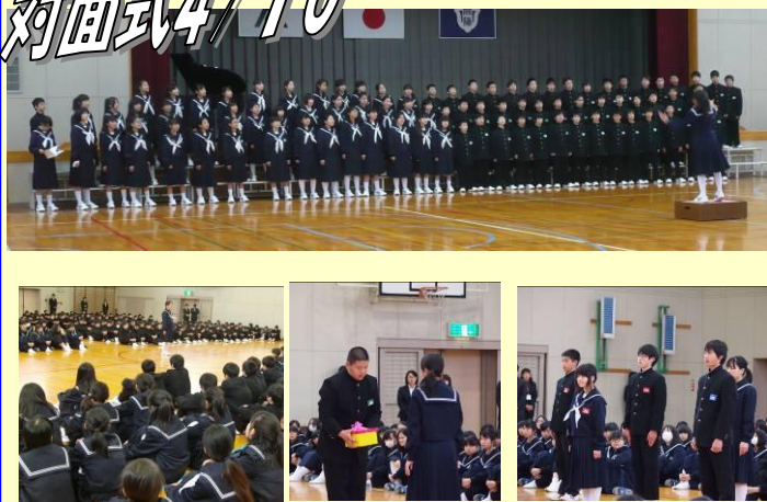
上級生の心のこもった話。新入生の目と耳と心で真剣に聴く姿。「自律」と「呼应」の心が表れた、最高の式にできました。