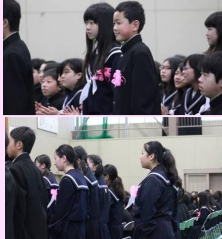
全校生徒が新年度の「高い志」をもち、「自律」の態度で、仲間と「呼应」し合い、素晴らしい入学式となりました。