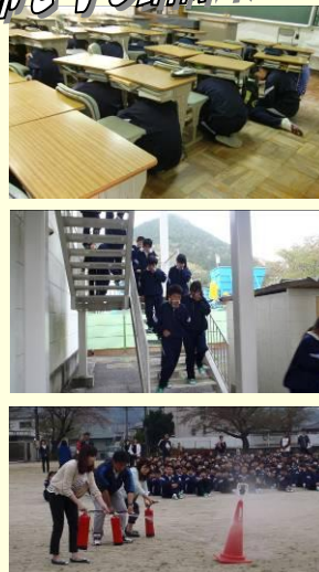
自分の命は自分で守る真剣さが伝わりました。