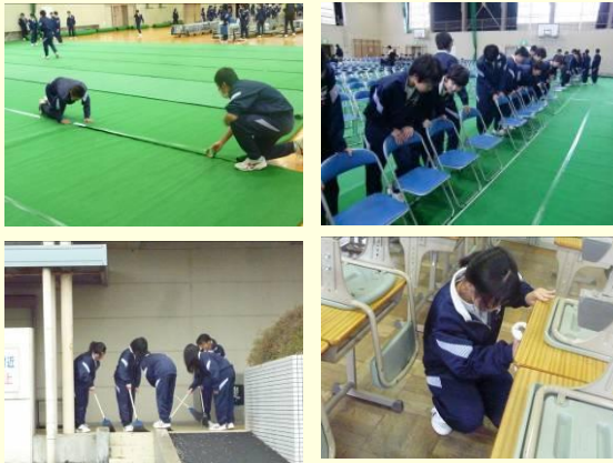
3年生が、最上級生として、新入生のために心を込めて会場準備をしました。その姿に「自律」の心が表れていました。