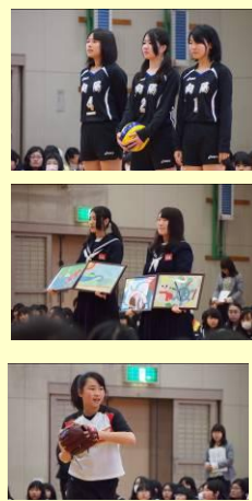
日常の中での「自律と呼应」で1年間の土台を築きました。