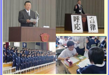
向陽中の顔として、3年生が堂々と合唱を披露しました。