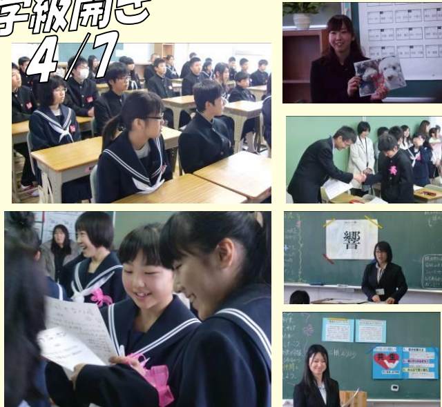
「高い志」を持った笑顔。「呼应」が実感できる素敵な出会いができました。